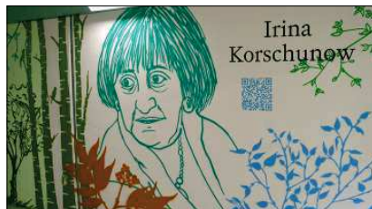
Die gebürtige Stendalerin Irina Korschunow (1925-2013) ist Autorin zahlreicher Kinder- und Jugendbücher, Romane und Drehbücher. Für ihre Arbeiten wurde sie mit vielen renommierten Preisen ausgezeichnet. Sie war Mitglied im PEN-Zentrum Deutschland.