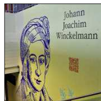
Stendals bekanntester Sohn, Johann Joachim Winckelmann (1717-1768), gilt als Begründer der wissenschaftlichen Archäologie und Kunstgeschichte. Sein Geburtshaus ist heute Teil eines Museums.