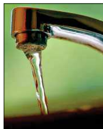
Leitungswasser wird 2022 in Stendal teurer.

Grund seien gestiegene Kosten für Personal, Wartung, Instandhaltung und Material. Zudem planen die Stadtwerke bis 2024 Investitionen in Höhe von