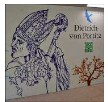
Dietrich von Portitz (um 1300-1367), Kugelwit genannt, wurde in Stendal geboren. Er gilt als einer der bedeutendsten Persönlichkeiten des Mittelalters, bekleidete hohe Staats- und Kirchenämter.